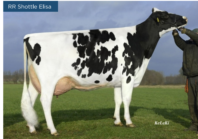
RR Shottle Elisa