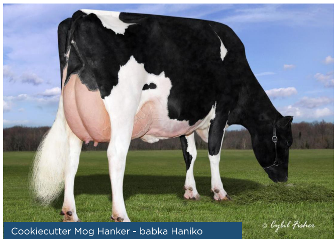
Cookiecutter Mog Hanker - babka Haniko