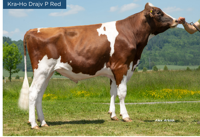
Kra-Ho Drajv P Red