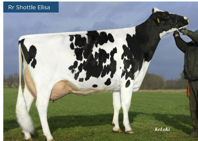
Rr Shottle Elisa