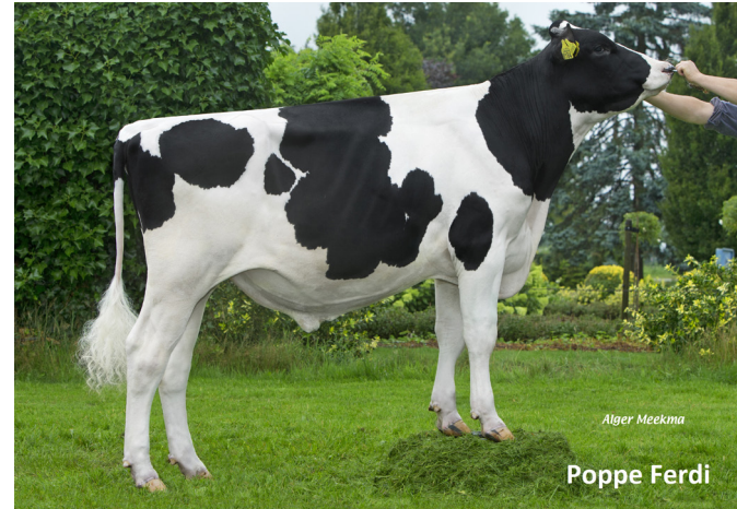
Alger Meekma Poppe Ferdi